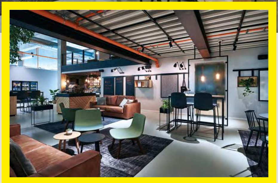
Das Interior Design im Deli begegnet dem Open-Space-Charakter mit wohnlicher Leichtigkeit.