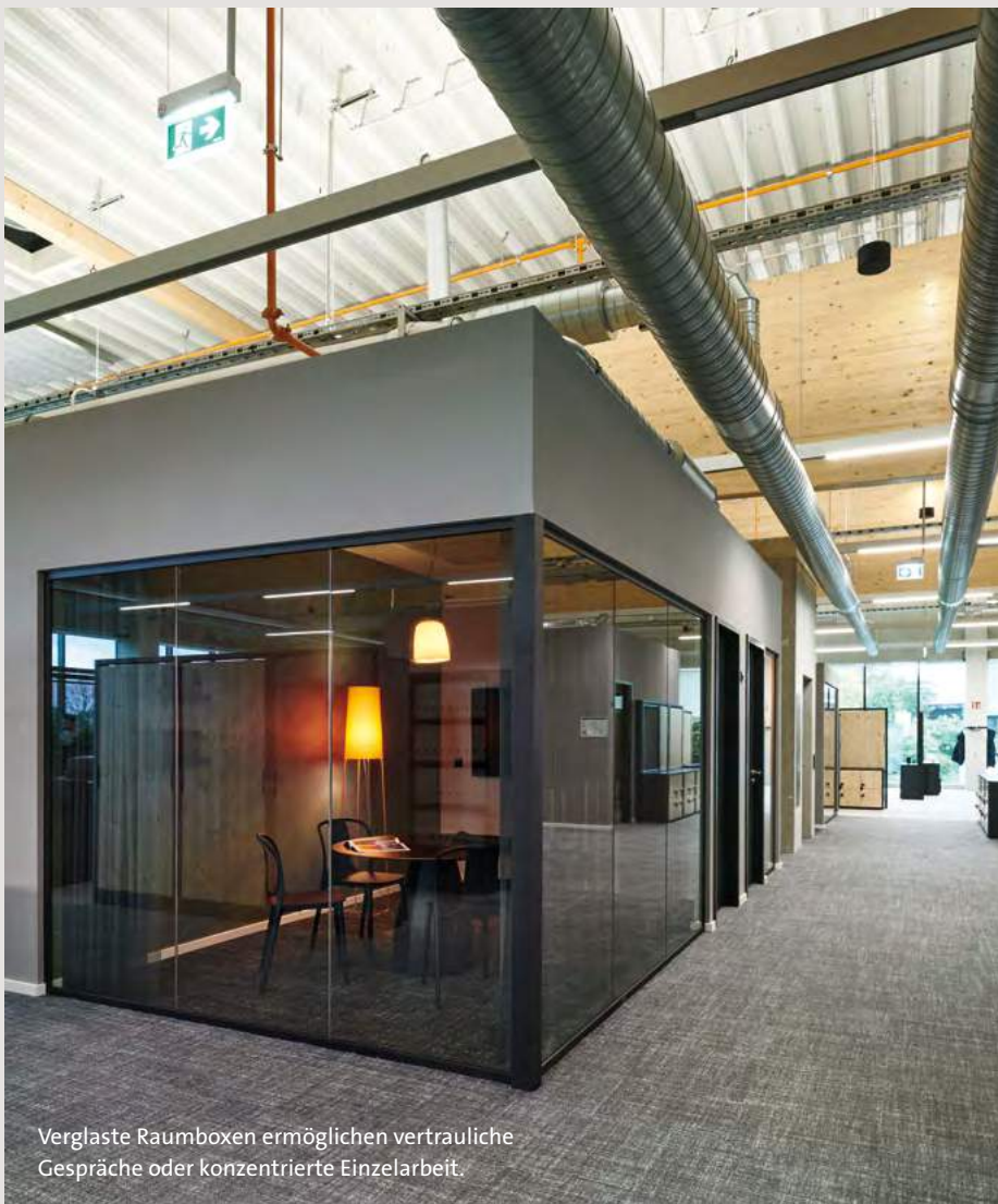
Verglaste Raumboxen ermöglichen vertrauliche Gespräche oder konzentrierte Einzelarbeit.

Als einen augenzwinkernden Verweis auf die Profession der List Gruppe haben die Innen-designer von Brandherm + Krumrey immer wieder Materialien aus der Baubranche verwendet: Streckmetall am Empfangstresen, Geländer mit Maschendraht oder Raumteiler aus verschiedenfarbigen Spanngurten geben dem Ganzen einen individuellen Touch.